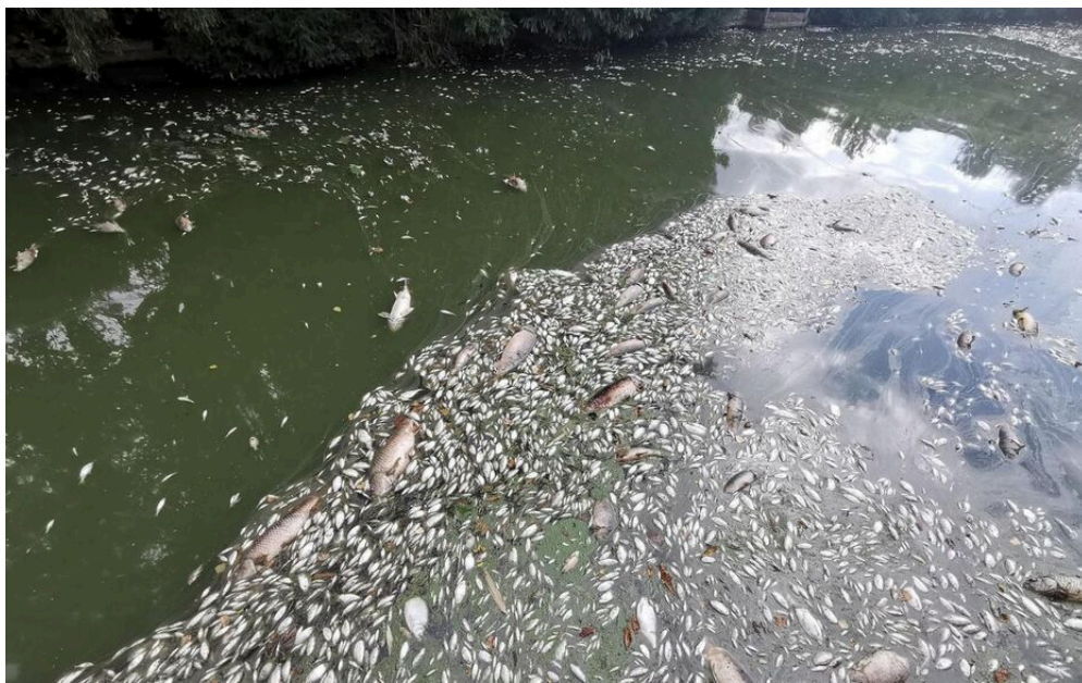
Illustration LeParisien/Raphaël Thomas, novembre 2020

Les riverains n'ont pas toujours conscience que la responsabilité d'entretien est la leur. Un certain abandon de la rivière est à déplorer. Les berges ne sont pas entretenues avec beaucoup de végétation en friche, et le fond du cours d'eau n'est pas nettoyé. Mais surtout, des incidents de pollution de particuliers viennent entacher la rivière régulièrement. L'un des derniers en date est intervenu en novembre 2020 : des centaines de poissons morts ont recouvert la rivière du côté de Vallangoujard sur une distance d'environ cinq cents mètres. Selon l'enquête de la police de l'eau, il s'agirait peut-être d'un empoisonnement dû au démoussage d'un toit. Le riverain aurait simplement rincé les produits chimiques utilisés en laissant les polluants se déverser jusqu'à la rivière. L'information a été publiée par A. Collin. (2020) dans un article du Parisien.