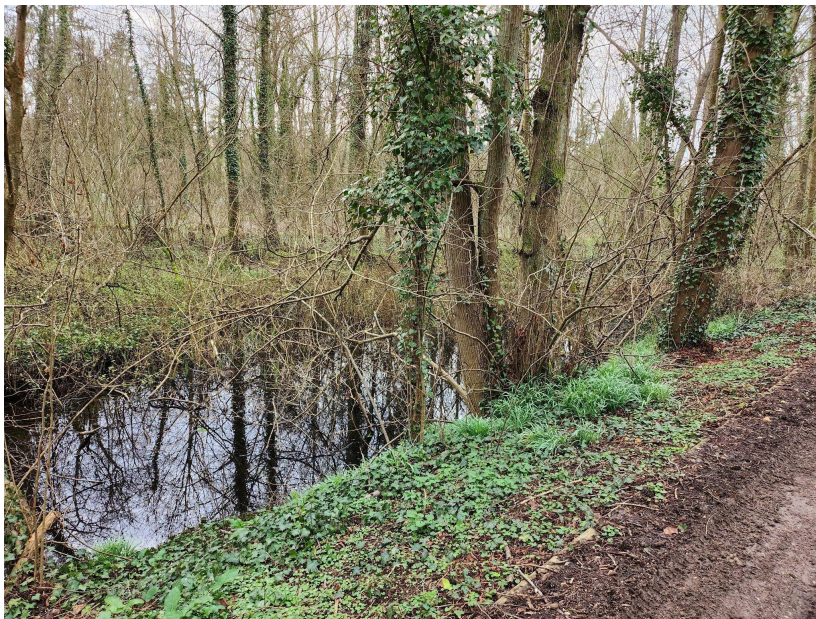
FIGURE (27) : route à vélo de Labbeville